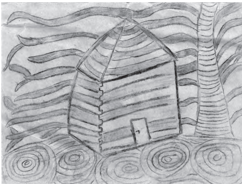
Ilustracija: Magdalena Fresl

Vreme ide, leta letiju, a ona i dale, tu na bregu stoji. Imala bi kaj povedat, al je ostala sama pak čkomi.