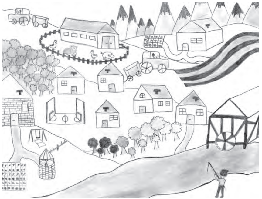
Ilustracija: Elena Šturbek