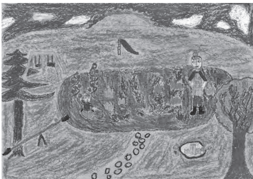
Ilustracija: Elena Malnar

Da me pogled njen obviije Znam da me za navek voli Zato draga mama moja Tvoj sinek ti nebu daval boli.