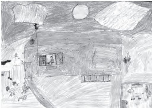
Ilustracija: Mia Jurša

A dok se to zbavi i malo si počine, zeme tašku na rame i v špencir gizdavo zgine.