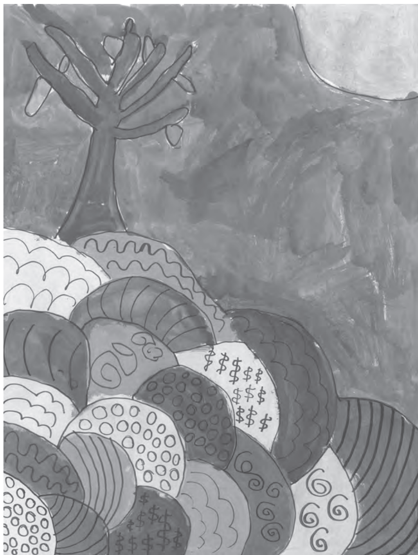
Ilustracija: Vida Vukušić