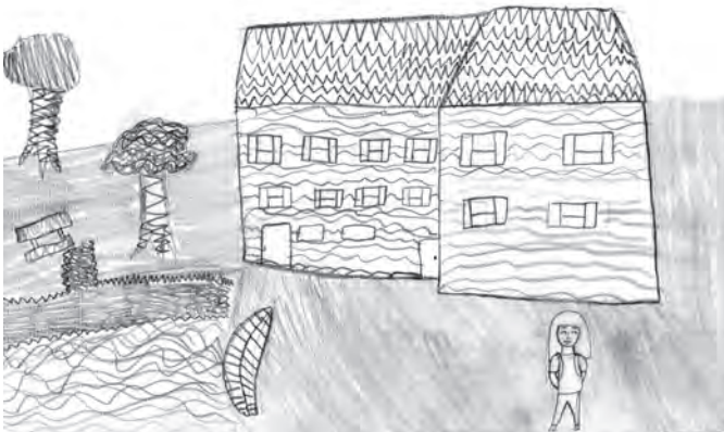
Ilustracija: Magdalena Ivšak

Školu nigdar napustila nebum i nemorem jer to je moj dom, najljepši dom.