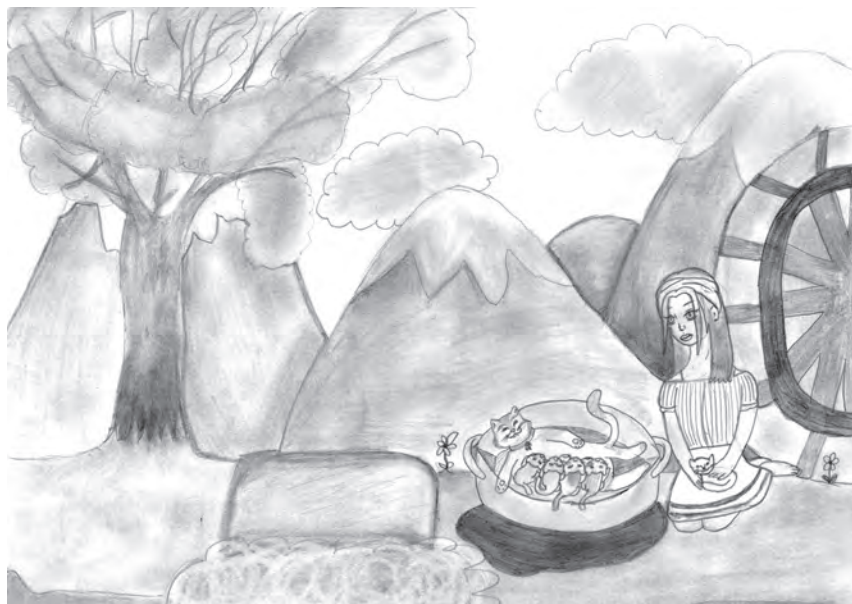
Ilustracija: Paula Novoselec

Treća je od druge mačke, žuta je i gore bela.