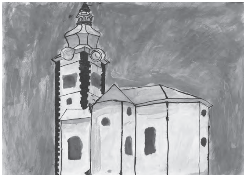
Ilustracija: Rebeca Zelić

I tak nedelje idejo... ...ljudi sako čakajo ka se pre cirkvi zidejo.