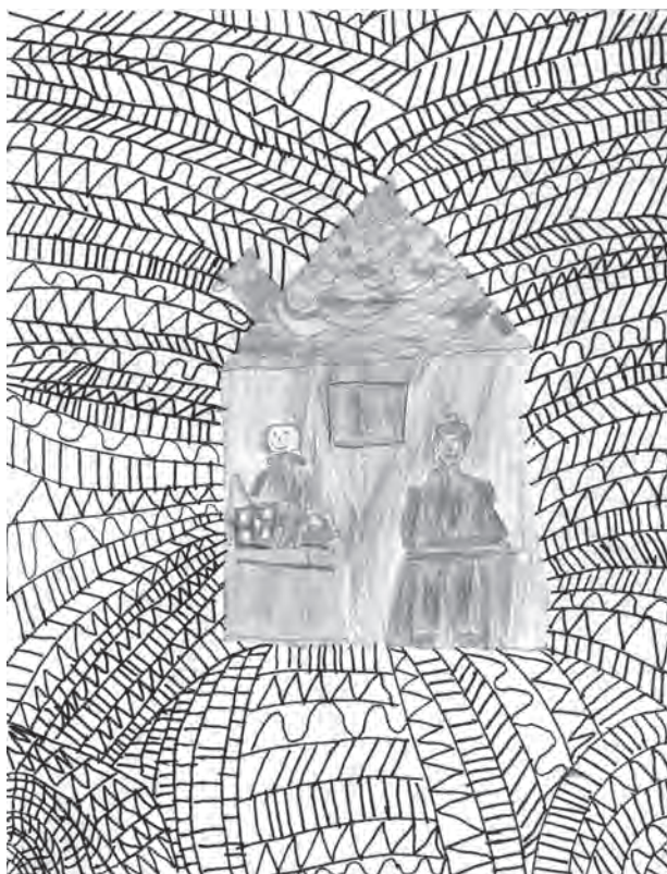
Ilustracija: Kristijan Vuković

Na šporetu se obed kuva. Danas bu bila govedska juva. Mama na stol meće žlice, kruv, tanjer i vilice. „Dobar tek!“, veli.