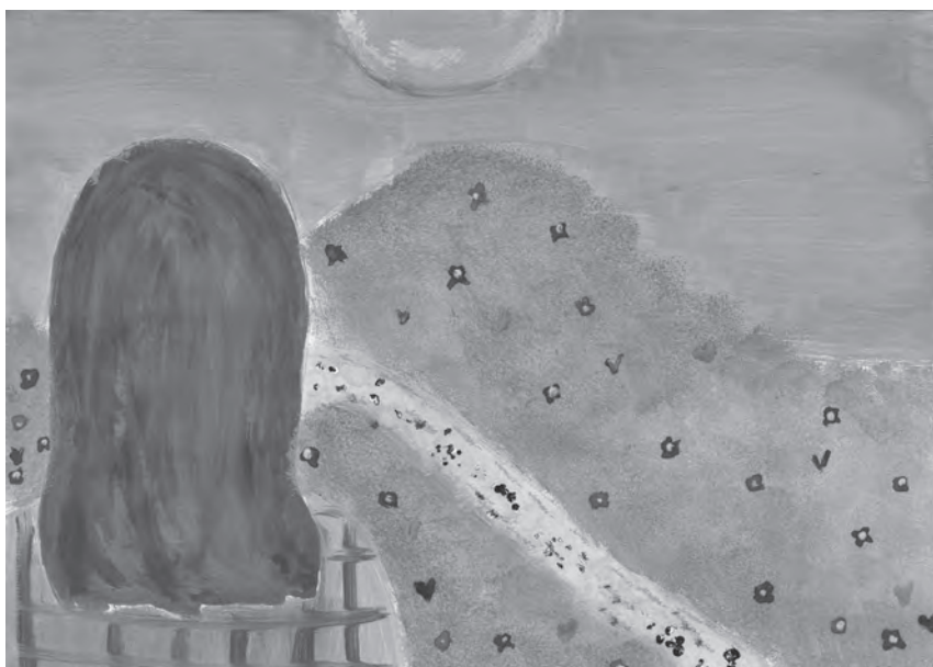
Ilustracija: Gabrijela Ratković

Kad zatelebaš se ti Više ti nište nemre pomoći. Moreš reći da ti je baš vsejene, Ali kad te odkanta, lice ti vene. To je kaki da ti mozak zgine, Kaki da cele vreme piješ vine. Črlen si ko jabuka, Vsi misle da ti je muka. Povije ti: „Volim te.“ V tvoje glave to zvuči: „Ženim te.“ Kad se zatelebaš ti, Z Zemlje zbrisan si.